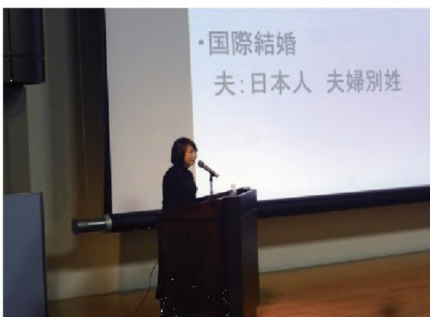
進路指導研修会「私が青森県に住む理由」