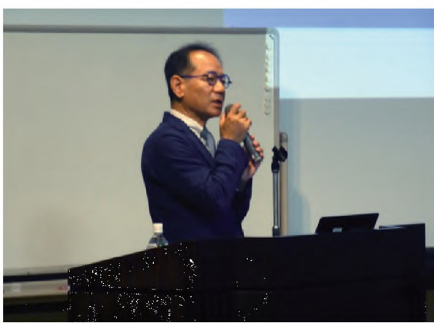
健全・研修合同研修会