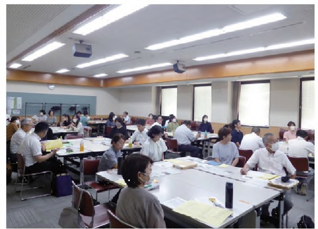
広報紙づくり研修会