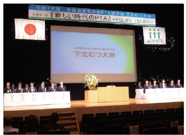
県高P連下北むつ大会